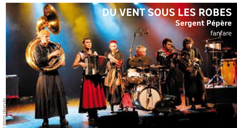
DU VENT SOUS LES ROBES Sergent Pépère fanfare

D'après l'oeuvre de François Rabelais / adaptation et interprétation : Julien Mellano / mise en scène : Damien Bouvet / son : Matthieu Dehoux / lumière : Rodrigue Bernard / musique : Olivier Mellano. Production Collectif Aïe Aïe Aïe. Coproduction et soutien Le Théâtre de L'Espace - Scène Nationale de Besançon, Centre Culturel Athéna - Scène de Territoire à Auray, L'Archipel - Scène de Territoire à Fouesnant-les Glénan, ministère de la Culture et de la Communication - DRAC Bretagne, Conseil Régional de Bretagne.