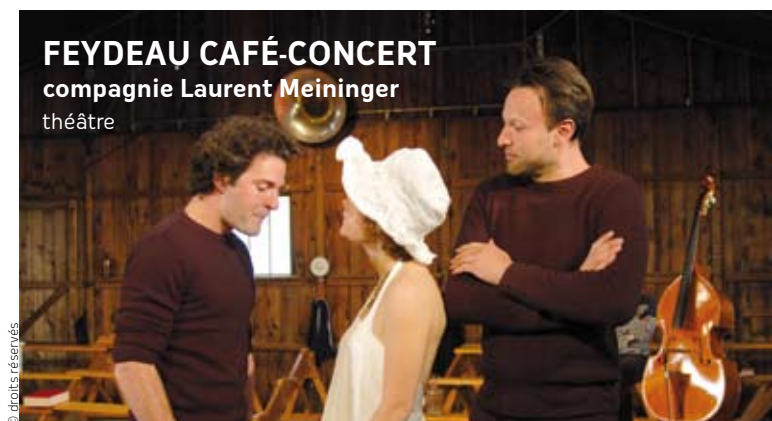
Feydeau CAFÉ-CONCERT compagnie Laurent Meininger théâtre

Mise en jeu : Philippe Languille / Costumes : Cécile Pelletier / Lumières : Yann Duclos. Coproduction et soutien Le Fourneau - Centre National des Arts de la Rue, Centre Culturel Pôle Sud - Chartres de Bretagne, l'Antipode - Cleunay.