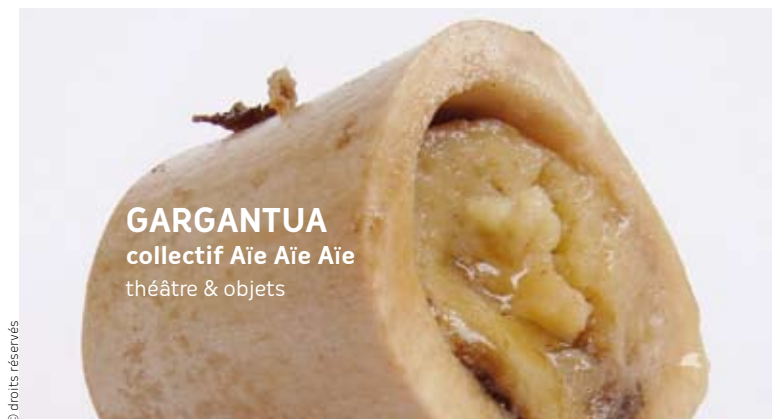
GARGANTUA collectif Aïe Aïe Aïe théâtre & objets

Centre des Arts - Concarneau 02 98 50 36 43 L'Archipel - Fouesnant 02 98 51 20 24 Centre Culturel - Rosporden 02 98 59 80 42 MJC Le Sterenn - Trégunc 02 98 50 95 93